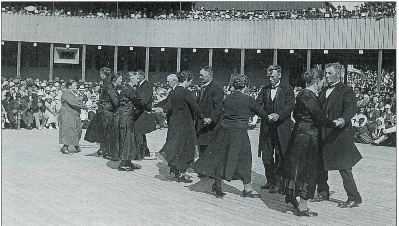
Bjerregravfolkene danser skotsk ved landsstævnet i Ålborg 1937.

Hvordan kan sådan en myte opstå ? I 1940'erne - 50'erne lavede man forskellige hjemstavnsoptrin, der var lig dilettantforestillinger. I disse hjemstavnsspil var dansen en vigtig del, og netop fra Randersegnen havde man et "skuespil", der hed "Bryllupsfest på Randersegnen", måske er myten opstået dér; men det kan også være en folkedanserleder, der engang har sagt, at han troede, det havde været sådan - eller måske èn, der blot har haft en livlig fan-