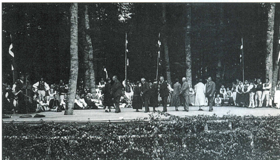
Bjerregravfolkene danser Menuet ved Landsstævnet 1930.

Den kendte forfatter og tegner, Achton Friis, kom tilfældig forbi og så